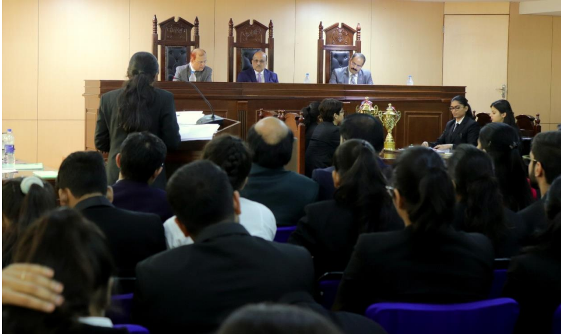
Hon'ble Judges judging Final Round on the Board