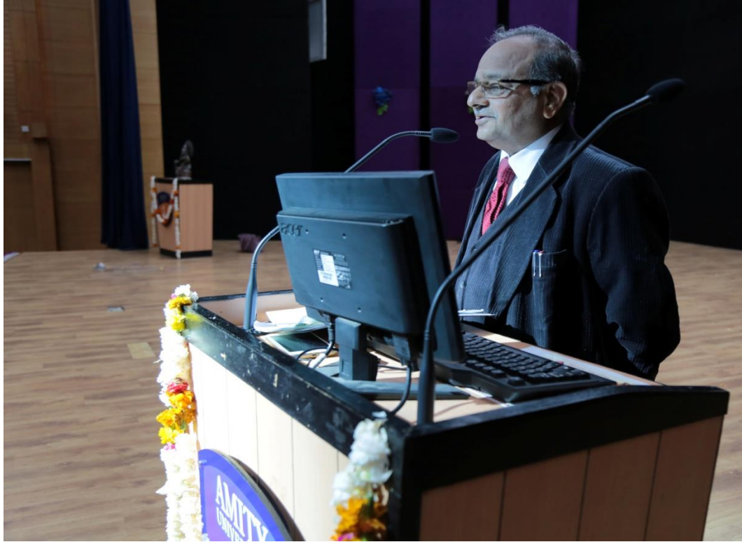
Hon'ble Mr. Justice A.K. Shrivastava (Retd.) Addressing Cultural Eve