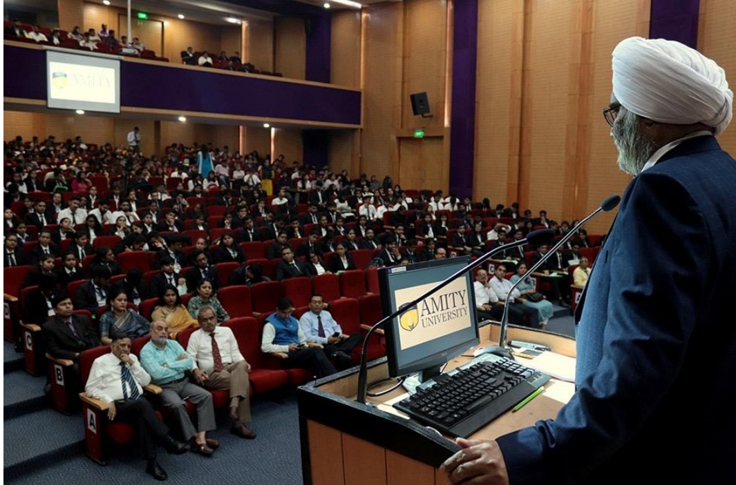
Hon'ble Mr. Justice G.S. Ahluwalia delivering Inaugural Speech