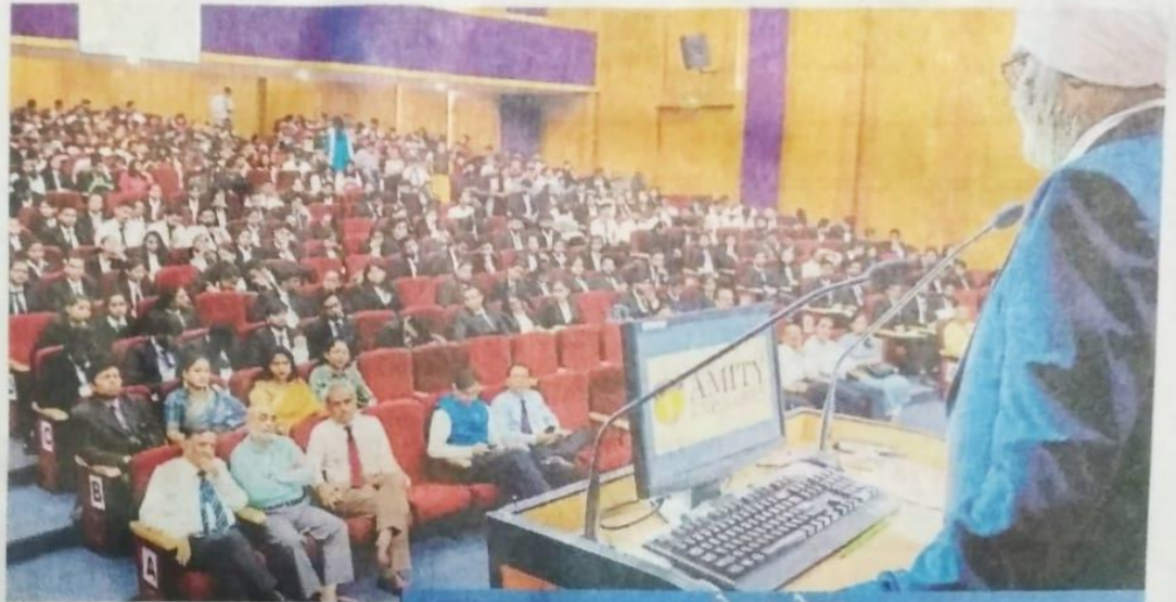
ये था केस