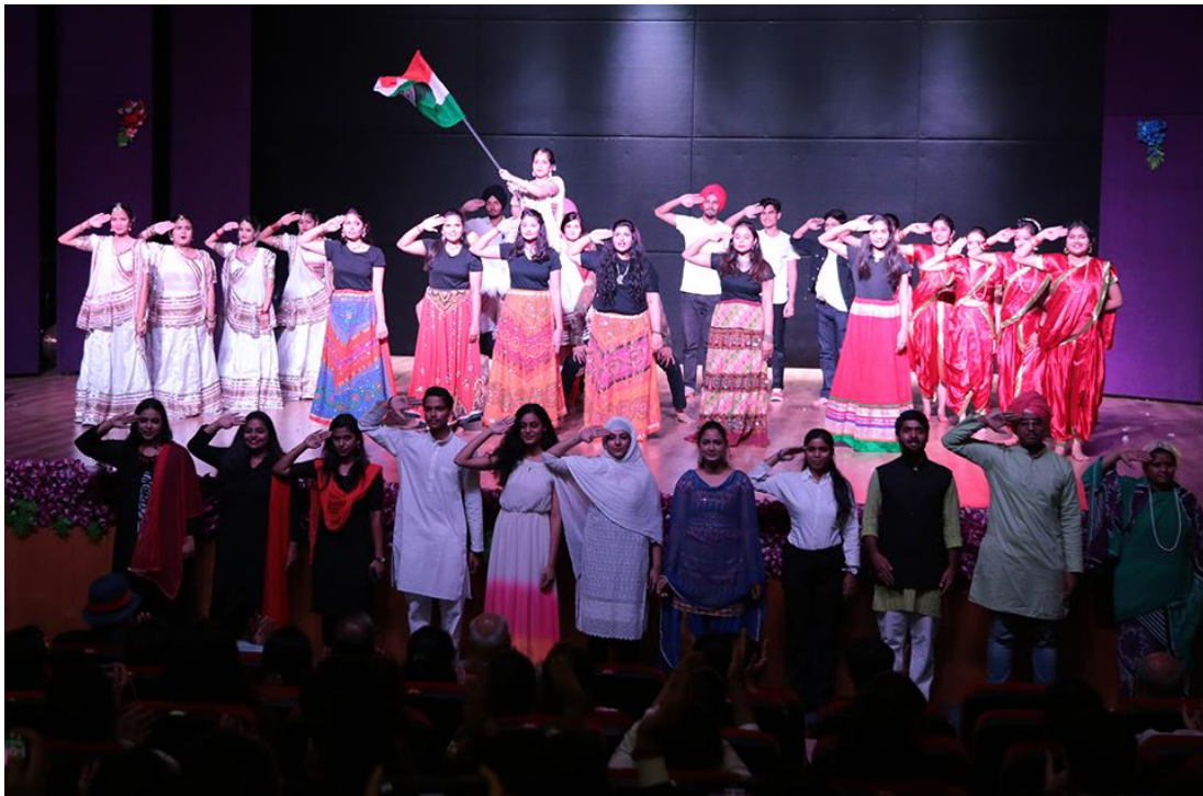
Cultural Evening on 27 September 2019