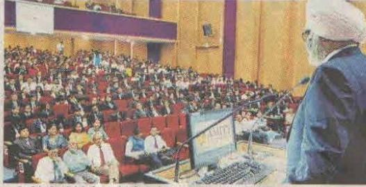
• एमिटी यूनिवर्सिटी में छात्रों को संबोधित करते जस्टिस जीएस अहलूवालिया।

आगमंत महत्वपूर्ण होते हैं। इसलिए वकील को पूरी तैयारी के साथ कोर्ट आना चाहिए। सामने वाला वकील क्या-क्या सवाल कर सकता है, इस बारे में भी सोचें और अध्ययन करें। इस तरह बेहतर ढंग से सवाल-जवाब हो सकते हैं। वकील को शब्दों का भी ध्यान रखना चाहिए। यह बात हाईकोर्ट के जस्टिस जीएस अहलूवालिया ने कही। वह एमिटी यूनिवर्सिटी में जेपी गुप्ता स्मृति में नेशनल मूट कोर्ट कॉम्पटीशन के शुभारंभ पर लॉ के विद्यार्थियों को संबोधित कर रहे थे। उन्होंने कहा कि एविडेंस का निष्कर्ष एक